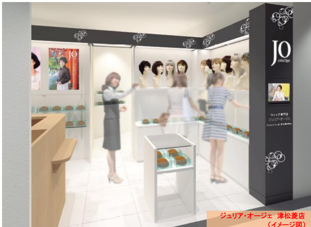
ジュリア・オージェ 津松菱店 (イメージ図)

「ジュリア・オージェ 津松菱店」は、津市内唯一の百貨店として地元の方々より親しまれている松菱百貨店1Fの化粧品・おしゃれ雑貨フロアに新規オープンします。自毛を活かしながらボリュームをプラスする人気の部分ウィッグ「レフィア」シリーズをはじめ、簡単にイメージチェンジが楽しめるオールウィッグなど、豊富な商品ラインアップときめ細かなサービスでお客様をお迎えいたします。