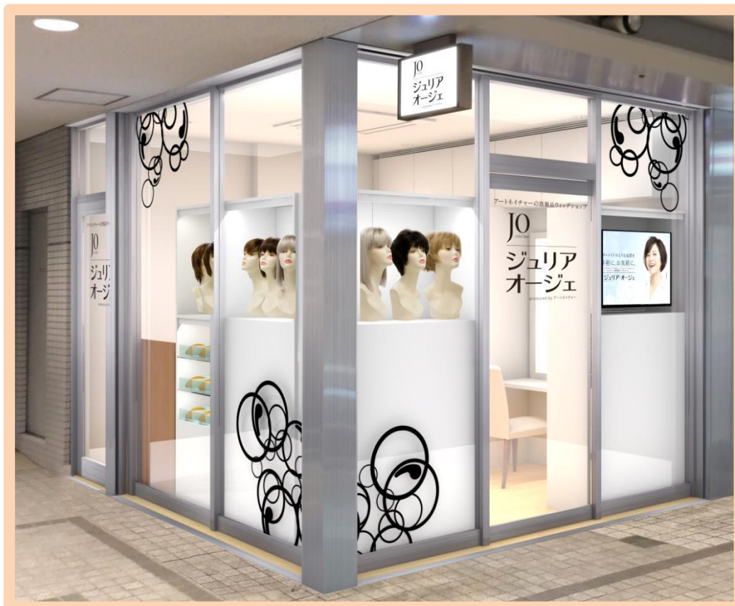
ジュリア・オージェ 姫路山陽店 (イメージ図)