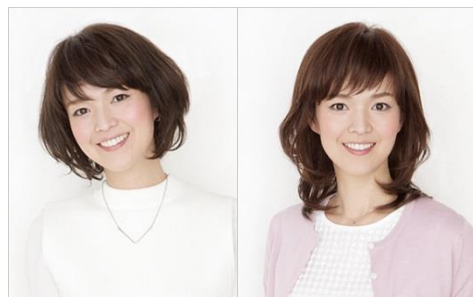
医療用ウィッグ『アックス』