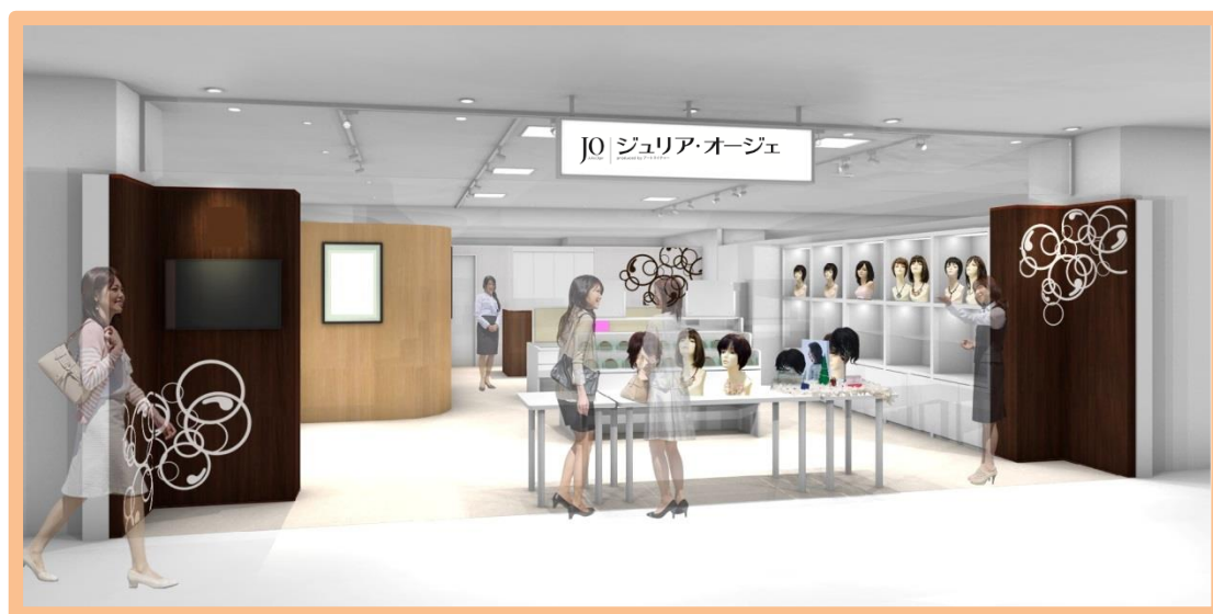
ジュリア・オージェ アイム小倉店 ※イメージ図