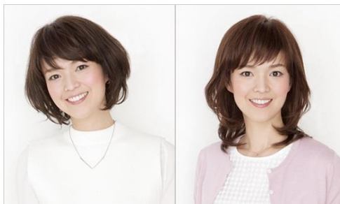
医療用ウィッグ『アックス』