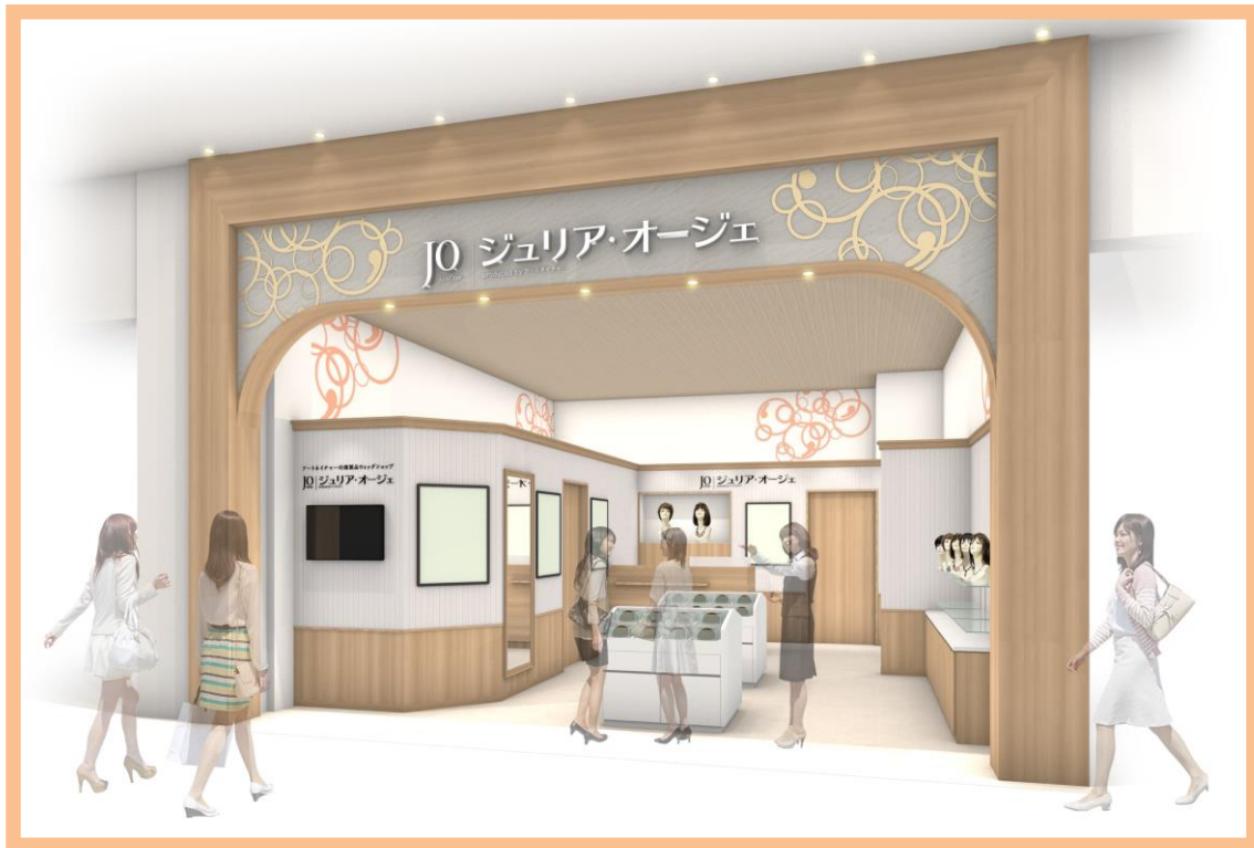
ジュリア・オージェ イオンモール大牟田店 ※イメージ図